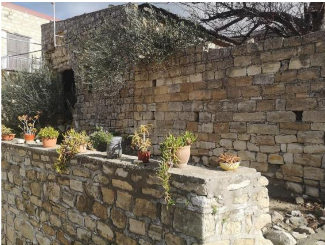
Το υπό εκτίμηση ακίνητο.